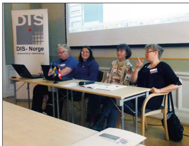
Bilden överst: Sverige-Amerika centret finns i residenset.