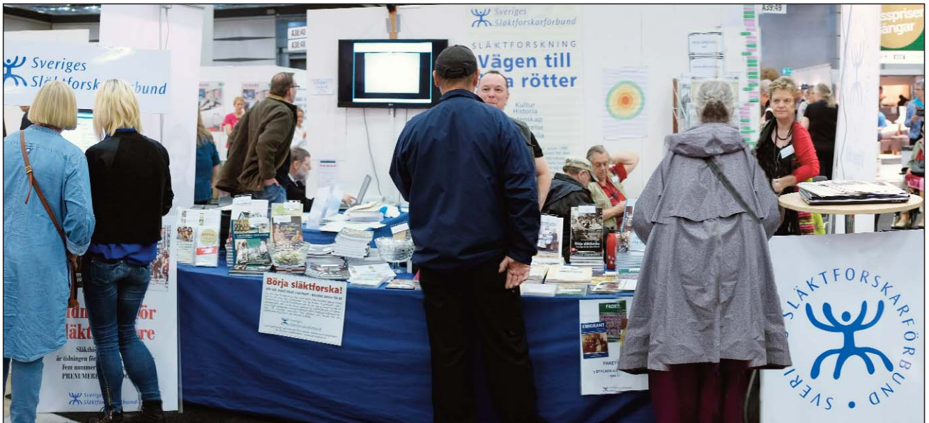
Många besök och stor åtgång på material i Förbundets monter.