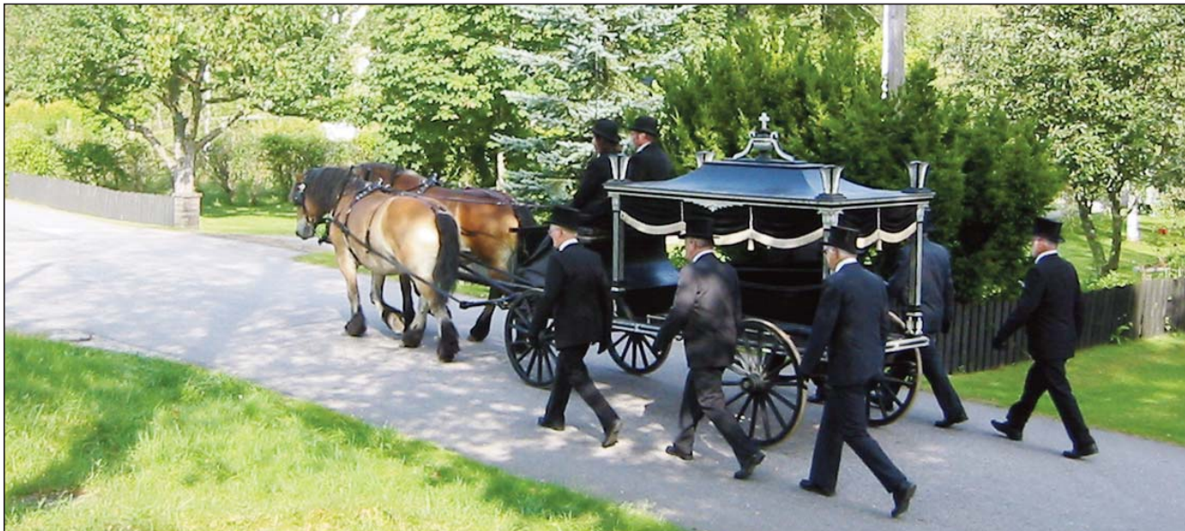
Sveriges Dödbok 5 ska omfatta tiden från 1901 och ska vara klar till Släktforskardagarna i Örebro. Bilden: Begravningsvagn från slutet av 1800-talet. Öja församling i Småland.